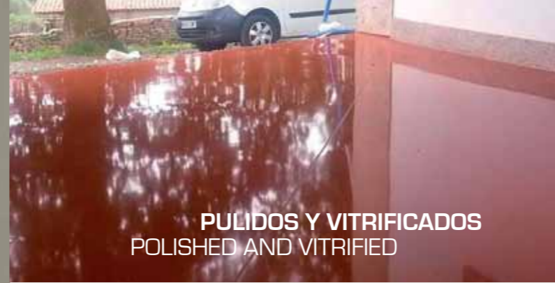
PULIDOS Y VITRIFICADOS POLISHED AND VITRIFIED

We restore, vitalize and personalize Your project.