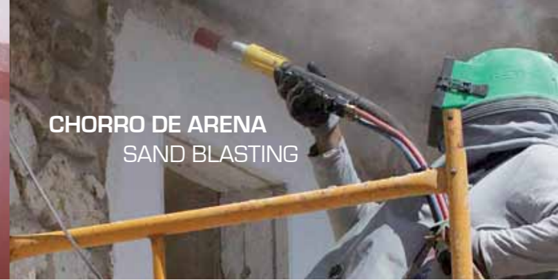
CHORRO DE ARENA SAND BLASTING