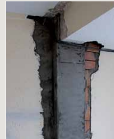
HORMIGONES ESPECIALES SPECIAL CONCRETES