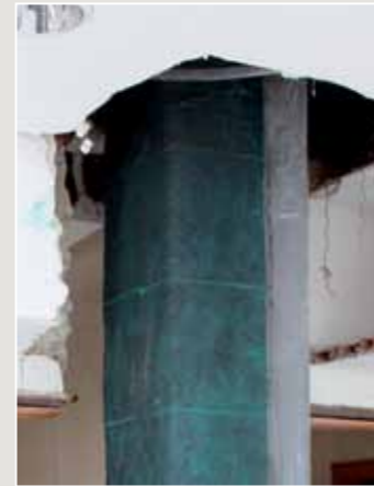
FIBRA DE CARBONO CARBON FIBER